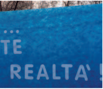
Horacio Conde C.S.C.x4