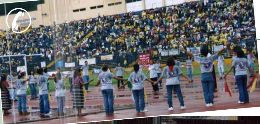
Al centro. L'incontro tra alcuni fondatori a Sant'Egidio il 26 novembre scorso. Giornata dei Movimenti a San Salvador (in alto) e a Lima (Perù) (in basso)