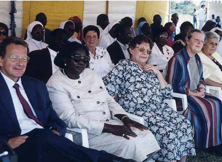
Sopra. L'arcivescovo Ndingi di Nairobi procede al taglio del nastro. A lato. Tra gli invitati Mama Ngina Keniatta (seconda da sinistra).

inaugurato per i sacerdoti un centro di spiritualità comunitaria